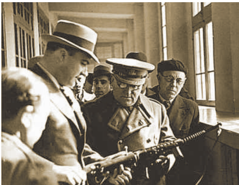
Tarradellas examina un subfusil ante la mirada del general Miaja

Los diarios inéditos de Tarradellas es una de la sección más llamativa del segundo tomo de la Crònica de la Guerra Civil a Catalunya , el día a día de la contienda contada por encargo de la Generalitat y redactada por funcionarios, como el jefe de prensa.