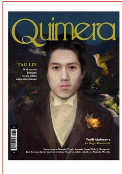
Portada de la revista Quimera dedicada al escritor.