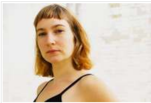
Sheila Heti (1976, Canadá)

Sheila Heti juega con nosotros por última vez a este retorcido juego. Cruzamos las líneas enemigas y descubrimos quién es. No puede fingir ser otra. En teoría, deberíamos haber ganado. Pero es ella la que sale victoriosa. Ella, que ha conquistado su propio nombre. Ella, que se ha vuelto ingobernable.