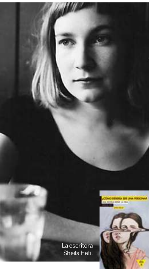
La escritora Sheila Heti.