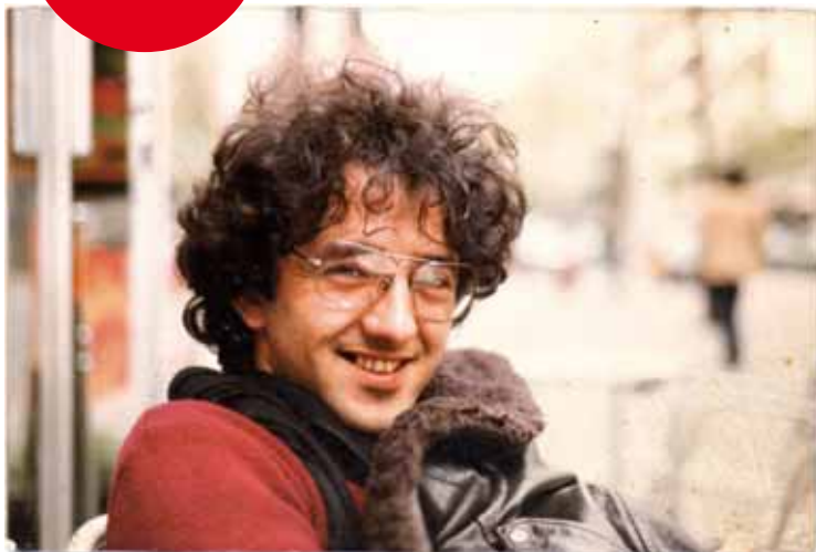
Roberto Bolaño, Girona

RES MILLOR PER AL DIA DEL LLIBRE QUE RECÓRRER L'UNIVERS LITERARI D'ARXIU BOLAÑO'