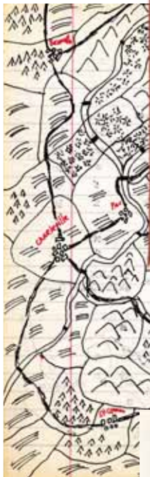
El Tercer Reich, mapa Manuscrit de Roberto Bolaño, 1986 © Hereus de Roberto Bolaño