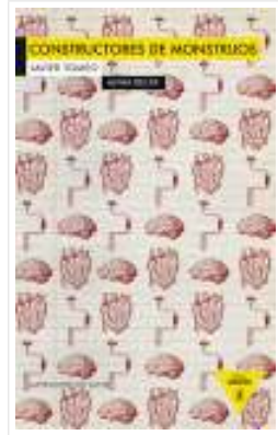
Javier Tomeo. Constructores de monstruos. Alpha Decay. Barcelona, 2013.

del asombro al reconocimiento, del descubrimiento a la extrañeza. Porque, como señala Rocío Moriones en el prólogo, “a través de sus páginas, el lector se adentrará en una época de la cultura india aún prácticamente desconocida en España, quizá con la extrañeza y el asombro propios del explorador de un mundo nuevo, pero con la satisfacción del hallazgo de la riqueza de la cultura indoislámica que sin duda para él evocará la propia fusión islámica que se produjo en la Península Ibérica y de la que nosotros mismos somos producto.”