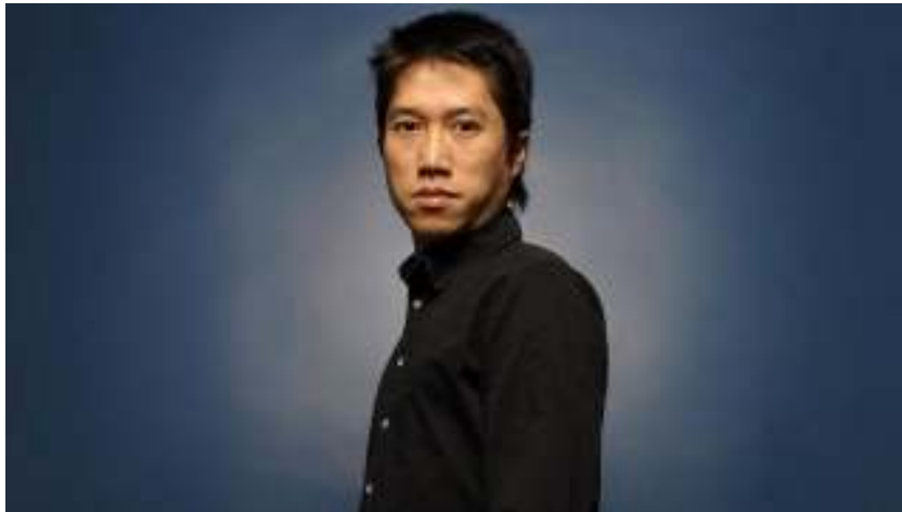
Tao Lin, en posición

Tao Lin ( http://www.taolin.info/ ) es el escritor joven más conocido del mundo. Acapara portadas, encabeza fenómenos literarios -Alt Lit, o Literatura Alternativa, una etiqueta que engloba a un conjunto de escritores que basan su trabajo o su temática en Internet y el uso de las redes - y es sujeto y promotor de cotilleos en blogs y foros. Su prosa pretendidamente distante mezcla autobiografía, chats con sus amigos y tedio perpetuo.