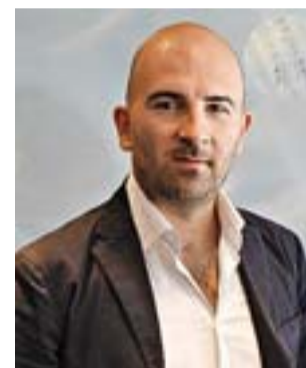
El escritor y criminólogo.