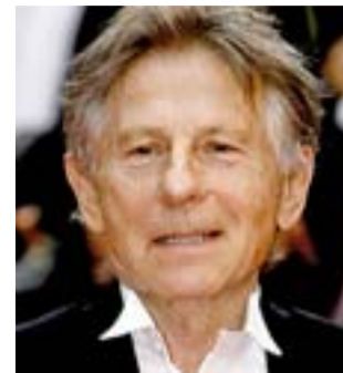
El director de ‘El pianista’.