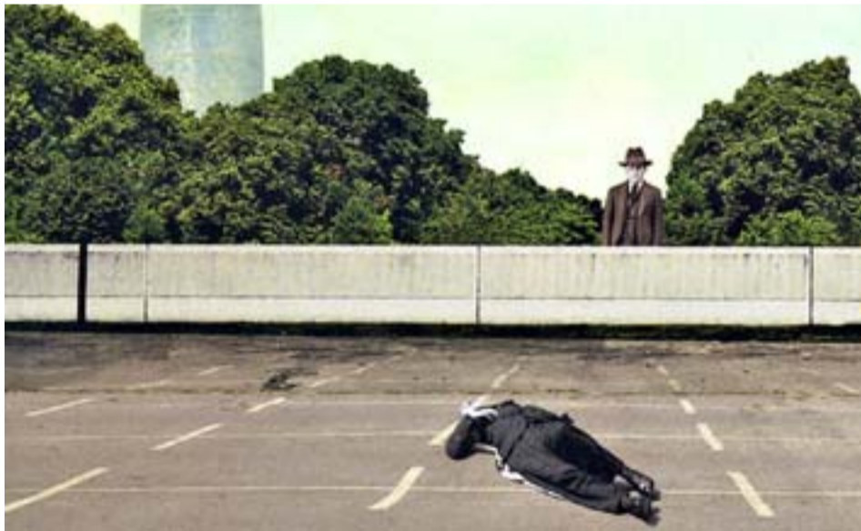
Detalles de las portadas de 'Un asunto sensible' y 'Matar en Barcelona'.