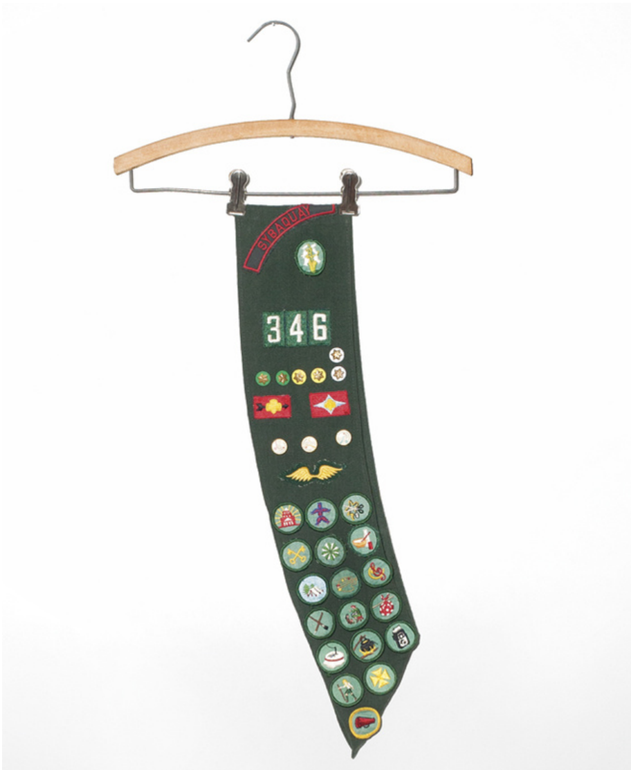
La diseñadora de moda Cynthia Rowley narra la historia de su banda de Girl Scout.