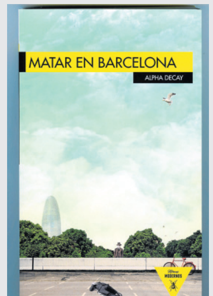
Matar en Barcelona VV.AA. Alpha Decay / 19 euros