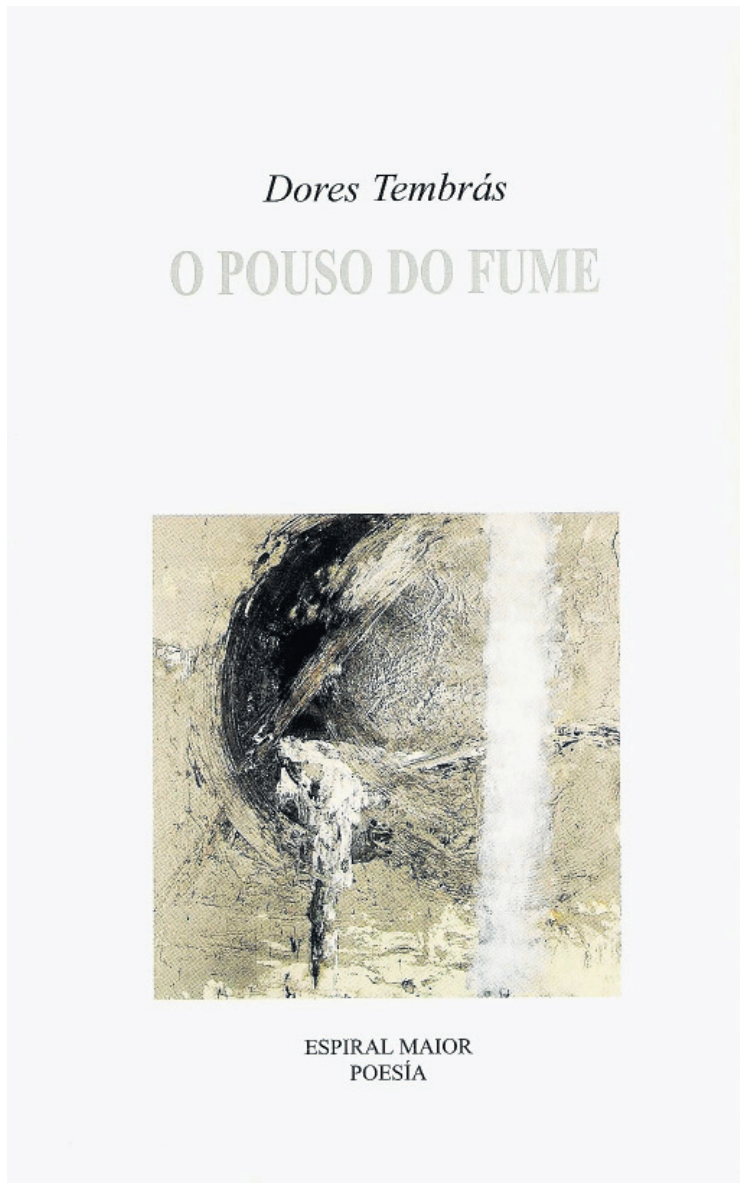
Capa do poemario de Tembrás

Ese tempo da nenez que endexemais ha marchar definitivamente porque viaxa na nosa memoria e nos configura, ese espazo das xeirás e andainas primeiras nas que adprendemos a ser pobo son vistos por Tembrás como cicatrices do ser balorecido que còmpre revivir na acordanza para cauterizar un presente de palabras que tenta ser unha cartografía salvífica. Veláí a razón de ser da estrutura tripartita do poemario: “Oxidación”, “Combustión” e “Pouso”, coma se dun esconxuro procesual, unha sorte de salmodia