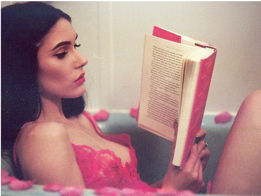
—Imagen de Hana Haley

(https://www.facebook.com/sharer/sharer.php?u=http://www.playgroundmag.net/articulos/columnas/tao-lin_0_1520847907.html) (https://twitter.com/intent/tweet?original_referer=http://www.playgroundmag.net/articulos/columnas/tao-lin_0_1520847907.html) (mailto:?subject=La%20juventud%20est%C3%A1%20sobrevalorada%3B%20el%20amor%20ya%20no%20importa&body=http://www.playgroundmag.net/articulos/columnas/tao-lin_0_1520847907.html)