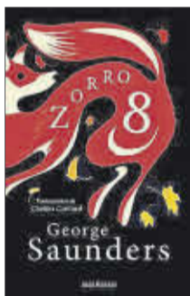
Zorro 8 George Saunders Seix Barral 14 euros

George Saunders regresa a las librerías españolas con esta fábula ecologista, en la mejor tradición de Roald Dahl y La colina de Watership , escrita con ternura, humor y una profunda convicción ética, y acompañada de las ilustraciones de Chelsea Cardinal. Zorro 8 es la carta de amor de un animal a los humanos y una llamada de atención a cuidar del medio ambiente.