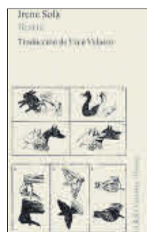
Bestia Irene Solà La Bella Varsovia 14,46 euros