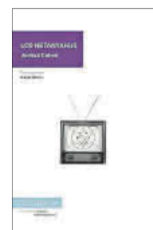
Los Netanyahu Joshua Cohen De Conatus 22,90 euros

Los Netanyahu es una comedia salvaje sobre la integración, la identidad y la política. En ella, Joshua Cohen nos descubre la historia cotidiana de la creación del Estado de Israel, la emigración judía en EEUU y las teorías sionistas sobre la expulsión de los judíos en la península Ibérica. Una novela que lleva al lector a preguntarse qué significa tener una identidad, ya sea nacional, religiosa o de género.