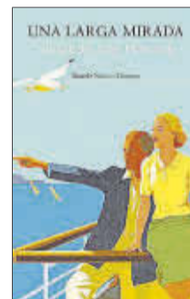
Una larga mirada Elizabeth Jane Howard Siruela 24,95 euros

Una larga mirada , una de las grandes novelas de Elizabeth Jane Howard, autora de las crónicas de los Cazalet y de la que en 2023 celebraremos centenario, es un repaso por la historia de los 20 años del matrimonio Fleming. Un viaje hacia atrás, tan delicado como implacable, por las alegrías y los sinsabores de la vida conyugal, desde el incierto presente hasta su luminoso primer encuentro.