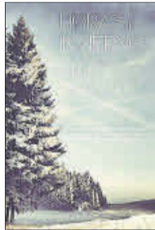
Horas de invierno Mary Oliver Errata Naturae 19 euros

Mary Oliver, fallecida en enero de 2019, es una de las voces más influyentes de la literatura contemporánea. Remota y discreta, pasa al primer plano memorialístico en esta hermosa miscelánea de textos en la que «todo cuanto aparece es cierto en el sentido más autobiográfico de la palabra». Nueve ensayos repletos de recuerdos y experiencias personales, acompañados de una breve selección de bellos poemas.