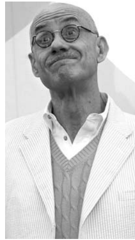
El escritor James Ellroy